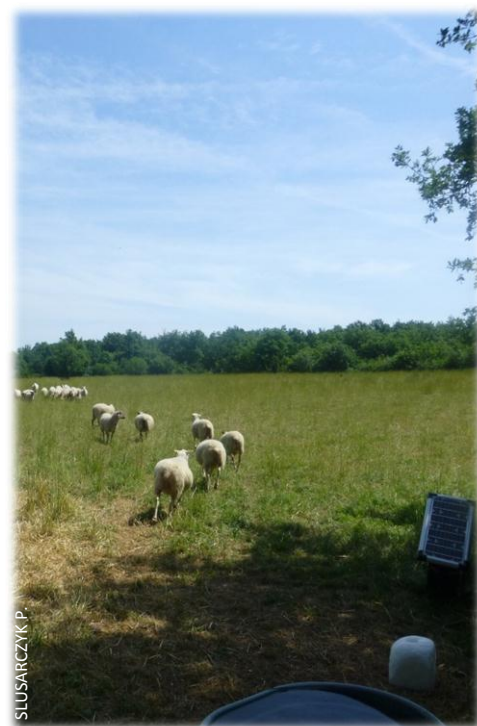
Les moutons sur les pelouses à Fley

moutons sur pelouses calcaires, il faut quotidiennement vérifier l'état de santé des bêtes, amener de l'eau, et surtout fréquemment déplacer les clôtures électriques. Cependant, il reste satisfait de ce type de pâturage car les bêtes sont sur un terrain sain, avec une herbe peu abondante, mais de bonne qualité et il n'est pas nécessaire de compléter leur alimentation, contrairement aux bovins. Le maintien de son activité permet également aux collectivités d'avoir un entretien de ces terrains autant pour le paysage et la biodiversité que pour la lutte contre les incendies. Un bon exemple de pratique où chacun y trouve son compte ! P.S.