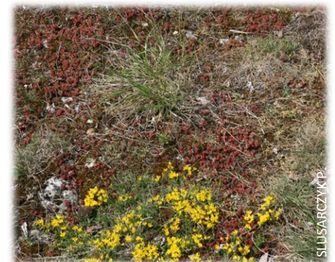
Pelouse pionnière sur dalle calcaire