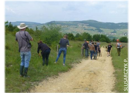
Les élèves ont restauré les clôtures

En juin, Natura 2000 s'est associé avec le CENB (conservatoire des espaces naturels bourguignons) pour l'opération de restauration des clôtures par les élèves du lycée de Fontaines aux Plains-Monts à Chassey-le-Camp. P.S.