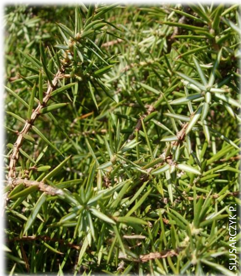
Epines de genévrier