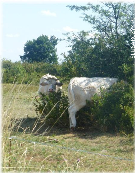
Les vaches s'abritent dans le buis.

Cette année, un nouvel exploitant agricole s'est engagé dans les MAE-T (mesures agroenvironnementales territorialisées). Cela montre que l'intérêt des agriculteurs pour l'exploitation des pelouses ne s'est pas amoindri. Au contraire, de nouveaux exploitants s'installent sur le site. Un broyage suivi d'un pâturage équin commencent sur la Roche (Chenôves); un broyage recommence et un pâturage ovin se réinstalle et s'étend sur les pelouses de Montagny-les-Buxy et la Roche