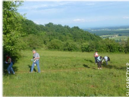
Découverte de la flore locale

De juin à août, trois randonnées nature ont eu lieu sur les Chaumes de Givry. De la traite des chèvres au fromage, en passant par le miel et la tisane, les visiteurs ont pu appréhender tout ce que la nature peut offrir à qui sait la préserver. Les balades au soleil couchant en compagnie d'un chevreuil, de papillons et d'une flore toujours exceptionnelle ont ravi les 42 participants. P.S.