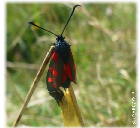
Le Zygène tout en légèreté

construisent leur cocon sur les chaumes des graminées et en sortent au printemps. Si les adultes sont presque toujours étonnantes de beauté ne vous y laissez pas tromper. Comme il est de rigueur dans le règne animal, leurs belles couleurs vives annoncent une grande toxicité. Elles sécrètent en effet des alcaloïdes et un poison proche du cyanure si elles se sentent en danger. P.S.