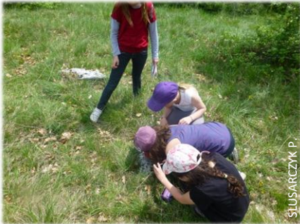
Concentration dans l'observation

En avril et mai, les enfants de l'école de Saint-Gengoux-le-National ont visité le mont Saint-Roch. Pour découvrir le monde naturel, ils ont fait des ateliers et exercices mais aussi des jeux, car c'est encore en s'amusant qu'on apprend le mieux ! Dommage que tous les élèves n'aient pas pu profiter d'une journée complète sur le site, le froid intense d'avril forçant les groupes à rentrer à l'école. P.S.