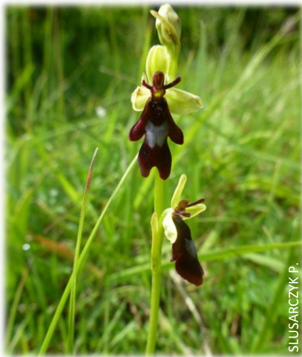
L'ophrys mouche, ou Ophrys insectifera

Les orchidées sont belles, les orchidées sont petites, les orchidées sont peu courantes. Si chacun a conscience de cela, en revanche, peu de personnes connaissent le fonctionnement un peu particulier que ces plantes ont développé. Les images parlent d'elles-mêmes, qui ne verrait pas la ressemblance de la fleur avec un insecte ? Selon l'espèce d'orchidée, cela peut être une mouche, une araignée, une abeille, un bourdon... Cette ressemblance, qui découle d'un long processus