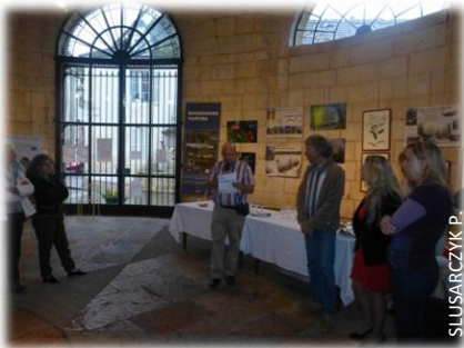
Inauguration de l'exposition

En septembre à Givry s'est tenue une exposition sur la biodiversité. Regroupement d'une exposition à tendance scientifique de l'INRA, accompagnée d'aquarelles et de photos d'un artiste-peintre et de panneaux sur Natura 2000, les habitants de Givry et des alentours ont pu découvrir les richesses de leur biodiversité locale. P.S.