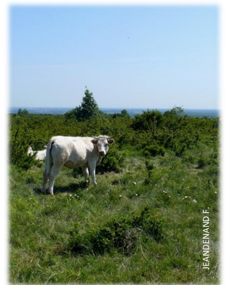
Les vaches en pâturage sur la Folie

de gestion afin de planifier les interventions sur ces sites pour les dix années à venir. Sur la base d'un diagnostic et en articulation avec Natura 2000, ce document définit les actions à prévoir afin de restaurer ou préserver les pelouses calcaires de ces sites. Pour assurer le maintien de ces milieux herbacés, nous privilégions une valorisation agricole de ces espaces par le pâturage ou la fauche. Sur la Folie, un pâturage bovin a été réinstallé en 2013 (13ha) et sera étendu en 2014 (5ha). J.F.