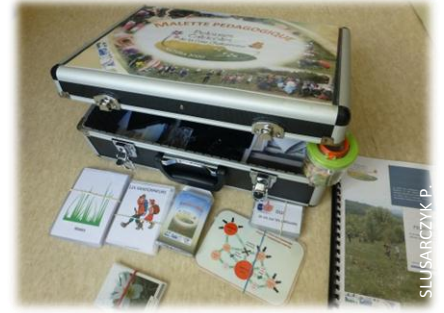
La mallette pédagogique en préparation

Tout au long de la saison, la mallette pédagogique a été présentée à divers acteurs du site. Cette mallette contient divers jeux et activités destinés à sensibiliser et à informer sur les pelouses calcaires et sur l'environnement. Toutes les personnes intéressées, enseignants ou non, peuvent contacter l'animatrice. P.S.