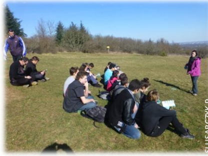
De nombreuses questions abordées

En février, 30 adolescents inscrits au raid Bourgogne et leurs animateurs sont venus s'entraîner à la course d'orientation sur les chaumes de Givry et les pelouses de la Vierge. Ils ont été sensibilisés à la protection de l'environnement, aux richesses des pelouses et aux bons comportements à adopter en milieux naturels sensibles. P.S.