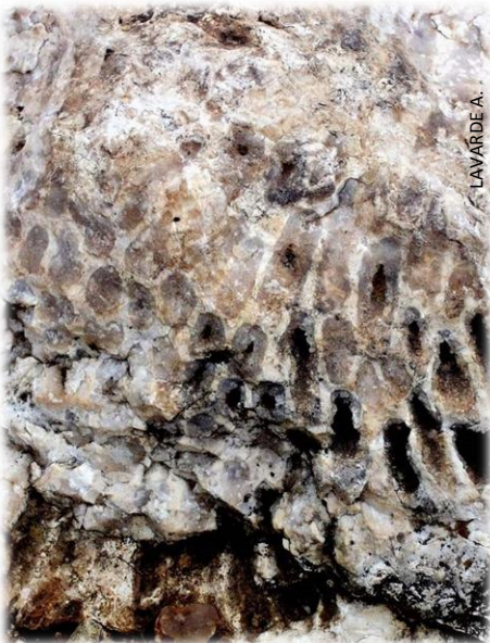
Détail du squelette de corail

Parmi les pierres qui dépassent l'herbe rase de la pelouse, il n'est pas rare de rencontrer un caillou globuleux à l'aspect plutôt étrange. Sa surface, plus ou moins arrondie, s'organise en hexagones réguliers. Le spécialiste ne s'y trompera pas, il s'agit d'un fragment de corail fossile de l'époque jurassique, vieux de 150 millions d'années. Cet animal qui a traversé les temps, continue à vivre au fond des mers chaudes. Fixé sur le fond de l'océan, il construit un squelette (polypier) en calcaire pur. Les vagues finissent par l'user et venir